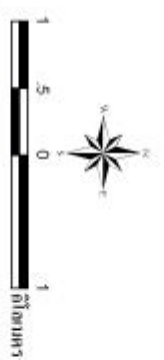
รูปที่ 3-3 แผนที่สภาพการใช้ที่ดิน ตำบลเกาะโพธิ์ อำเภอป่าหนือ จังหวัดน่าน